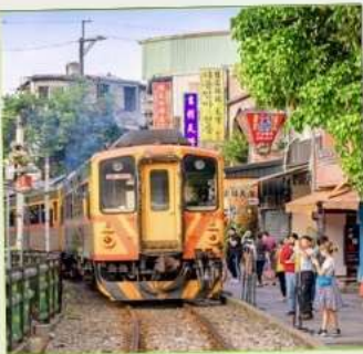
สถานีรถไฟสี่อเฟิน