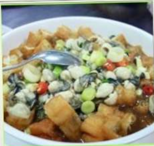
ถนนโบราณสี่อเฟิน