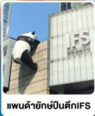
แพนด้ายักษ์ปีนตึกIFS