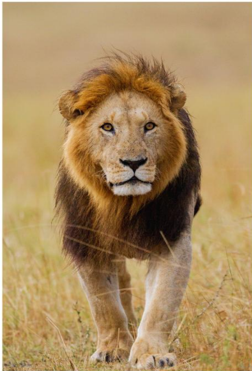
BIG FIVE GAME DRIVE

สัมผัสประสบการณ์สุดตื่นเต้น ชมสัตว์ป่าอย่างใกล้ชิดท่ามกลางธรรมชาติอันอุดมสมบูรณ์ ตื่นตาตื่นใจไปกับ "Big Five" อันเลื่องชื่อ ได้แก่ สิงโต ช้าง แรด ควายป่า และเสือดาว ที่ออกมาใช้ชีวิตอย่างอิสระในถิ่นอาศัยตามธรรมชาติ อีกหนึ่งไฮไลท์ที่ไม่ควรพลาด คือโอกาสในการชมปรากฏการณ์การอพยพของสัตว์ป่าขนาดใหญ่ ซึ่งชวนให้นึกถึงภาพอันยิ่งใหญ่คล้ายของ Maasai Mara National Reserve ที่มีชื่อเสียงระดับโลก