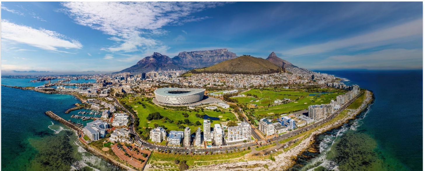
CAPE TOWN SOUTH AFRICA

01.00 น. ออกเดินทางสู่ กรุงไนโรบี ประเทศเคนยา เที่ยวบินที่ KQ887 06.05 น. เดินทางถึงท่าอากาศยานนานาชาติไนโรบี (แวะเปลี่ยนเครื่อง) 07.25 น. นำท่านออกเดินทางสู่ สนามบินนานาชาติเคปทาวน์ ประเทศแอฟริกาใต้ โดย สายการบิน Kenya Airways เที่ยวบินที่ KQ792 เดินทางเหนือระดับด้วยบริการระดับเวโลด์คลาสตลอดเส้นทาง 13.35 น. เดินทางถึง สนามบินนานาชาติเคปทาวน์ ประเทศแอฟริกาใต้ นำท่านผ่านขั้นตอนการตรวจคนเข้าเมืองและพิธีการทางศุลกากร และนำท่านขึ้นรถโค้ชเพื่อเดินทางสู่ เคปทาวน์ Cape Town เมืองท่องเที่ยวชื่อดังของ ประเทศแอฟริกาใต้ South Africa โดดเด่นด้วยทัศนียภาพอันงดงามของภูเขาและท้องทะเล ผสานกับวัฒนธรรมที่หลากหลายได้อย่างลงตัว ตั้งอยู่บริเวณปลายแหลมทางตอนใต้ของประเทศ จึงมีภูมิอากาศแบบเมืองตากอากาศที่สดชื่นตลอดปี นอกจากนี้ยังเป็นที่ตั้งของแหลมสำคัญที่มีชื่อเสียงระดับโลก อาทิ แหลมกู๊ด