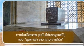
ภายในมีสิ่งศพ (แต่ไม่ได้นำศพไว้) ของ "มุสตาฟา เคมาล อตาเติร์ก"