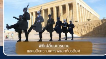
พิธีเปลี่ยนเวรยาม แสดงให้เห็นเคารพและเกียรติยศ

สถานที่สำคัญที่คนตุรกีให้ความเคารพและจดจำผู้นำผู้ยิ่งใหญ่ ที่อุทิศทั้งชีวิตเพื่อชาติ ศาสนา และประชาชน