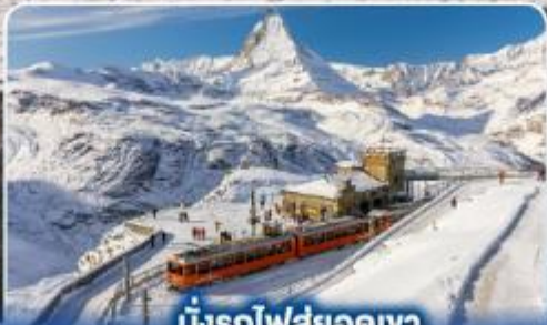
นั่งรถไฟสู่ยอดเขา กรอนเนอ์เกรต