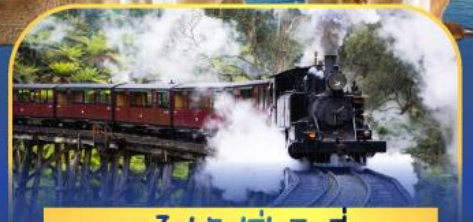
รถไฟพัพฟิงบิลลี่

ล่องเรือชมอ่าวซิดนีย์พร้อมรับประทานอาหารกลางวัน และ เข้าชมสวนสัตว์การองก้า