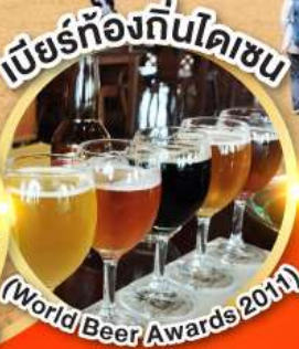
เบียร์ท้องถิ่นโดเซน (World Beer Awards 2011)

นั่งกระเช้าชมใบไม้เปลี่ยนสี ภูเขาโดเซน ฟูจิ แห่ง ทตโตริ