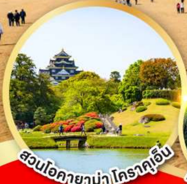
สวนโอคายาม่า โคราคูเอ็น