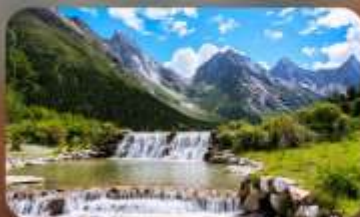
ปี้ฝิงโกว