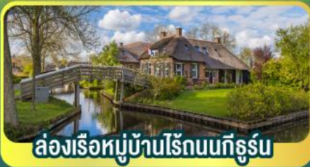
ล่องเรือหมู่บ้านไรนด์นทีกูร์น