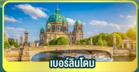
เบอร์ลินโดม