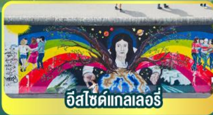
อีสไซด์แกลลอรี่