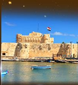
บ่อนสาธารณะ Quite Bay