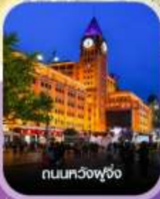
ถนนทวิงฟู่จิ่ง