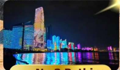
หาด No.3 Bathing

เมนูพิเศษ ซาบูสายพาน 6 วัน 4 คืน เดินทาง : พฤษภาคม 69