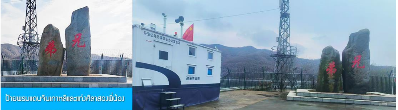
ป้ายพรมแดนจีนเกาหลีและแท่งศิลาสองพี่น้อง