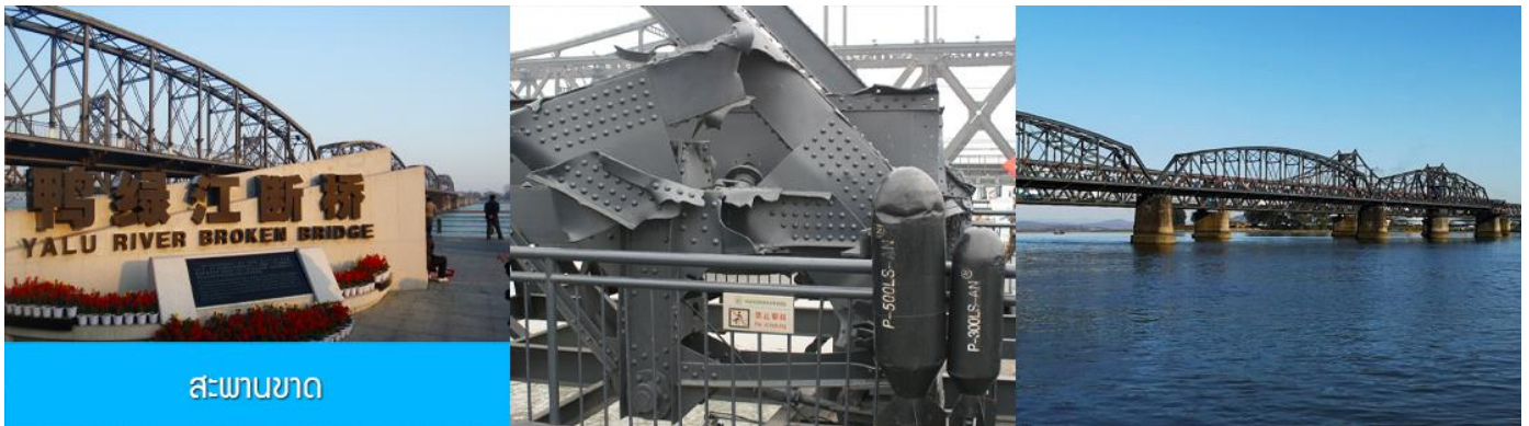
สะพานขาด