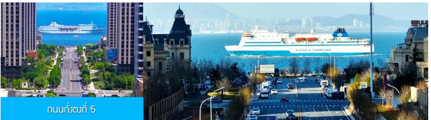
ถนนกั๋วตง 5