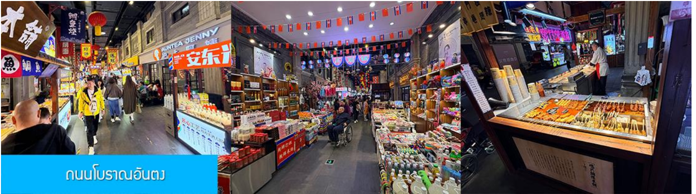
ถนนโบราณอันตง

จากนั้นนำท่านเที่ยวชม ถนนโบราณอันตง 安东老街 ถนนโบราณนี้มีชื่อเสียงในฐานะเป็นย่านการค้าที่คึกคักที่สุดในโลกกลางเมืองอันตง (ภายหลังได้เปลี่ยนชื่อเป็นต้นตง) ในปีค.ศ. 1876 ในสมัยราชวงศ์ชิง ปัจจุบันถนนสายนี้ยังคงไว้ซึ่งอาคารบ้านเรือนยุคเก่า(ราชวงศ์ชิง) และอบอวลด้วยวัฒนธรรมพื้นเมืองโบราณ ท่านจะได้สัมผัสการละเล่นและการแสดงพื้นเมือง ร้านค้าจำหน่ายของที่ระลึก ร้านอาหารท้องถิ่น และสตรีทฟู้ด ฯลฯ