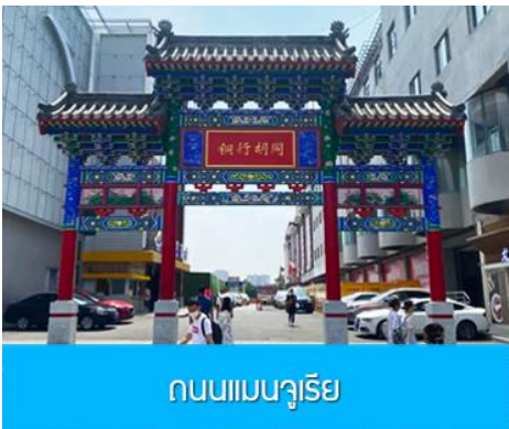
ถนนแมนจูเรีย