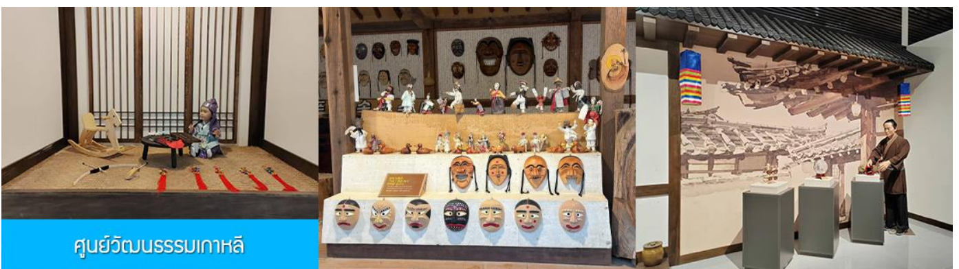
ศูนย์วัฒนธรรมเกาหลี

เช้า รับประทานอาหารเช้า ณ ห้องอาหารของโรงแรม (9)