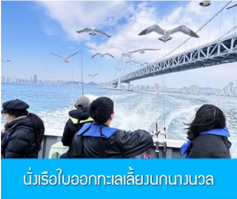
นั่งเรือใบออกทะเลลิ้นกนางนวล

ต่อด้วยนำท่านเที่ยวชมถนนรัสเซีย 俄罗斯风情街 ในอดีตที่นี่เป็นศูนย์ที่ตั้งของที่ทำการเมืองต้าเหลียน ภายหลังได้กลายเป็นชุมชนของพ่อค้าและวิศวกรทางรถไฟชาวรัสเซีย บริเวณนี้จึงเต็มไปด้วยอาคารบ้านเรือนแบบตะวันตก(รัสเซีย) มากมาย นอกจากนี้ได้เก็บภาพที่มีพื้นหลังเป็นอาคารสถาปัตยกรรมตะวันตก ที่นี้ยังมีร้านค้าที่จำหน่ายสินค้าและของที่ระลึกที่นำเข้ามาจากรัสเซีย อาทิ ช็อกโกแลต เหล้าวอดก้า ตุ๊กตารัสเซีย ฯลฯ