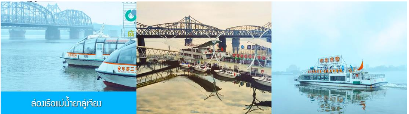
ล่องเรือแม่น้ำยาลู่เจียง

หลังอาหารให้ท่านพักผ่อนตามอัชชาศัยในโรงแรม