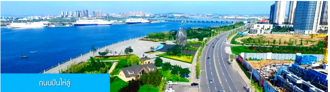
ถนนปินไห่หลู่

ล้อมด้วยตึกระฟ้าที่ทันสมัย ภายในมีบ่อน้ำพุคนตรี ลานหญ้าขนาดใหญ่ และลานกว้างสำหรับจัดกิจกรรม กลางแจ้ง อาทิ เทศกาลเบียร์นานาชาติ การแข่งขันวิ่งมาราธอน งานแฟชั่นนานาชาติเมืองต้าเหลียน ฯลฯ