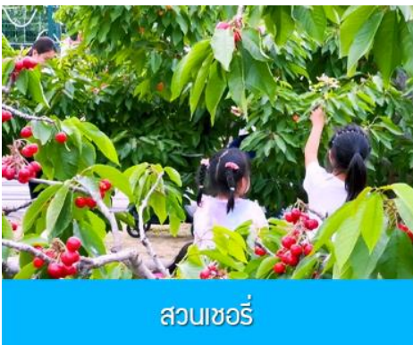
สวนชอร์รี่

หลังอาหารเช้า นำท่านโดยรถบัสสู่ เมืองตันตง 丹东 (ระยะทาง 300 กม. ใช้เวลาเดินทางโดยรถบัส ประมาณ 3 ชั่วโมงครึ่ง)