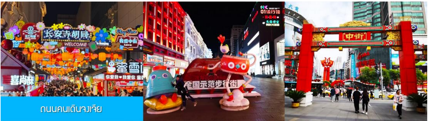
ถนนคนเดินจางเจีย