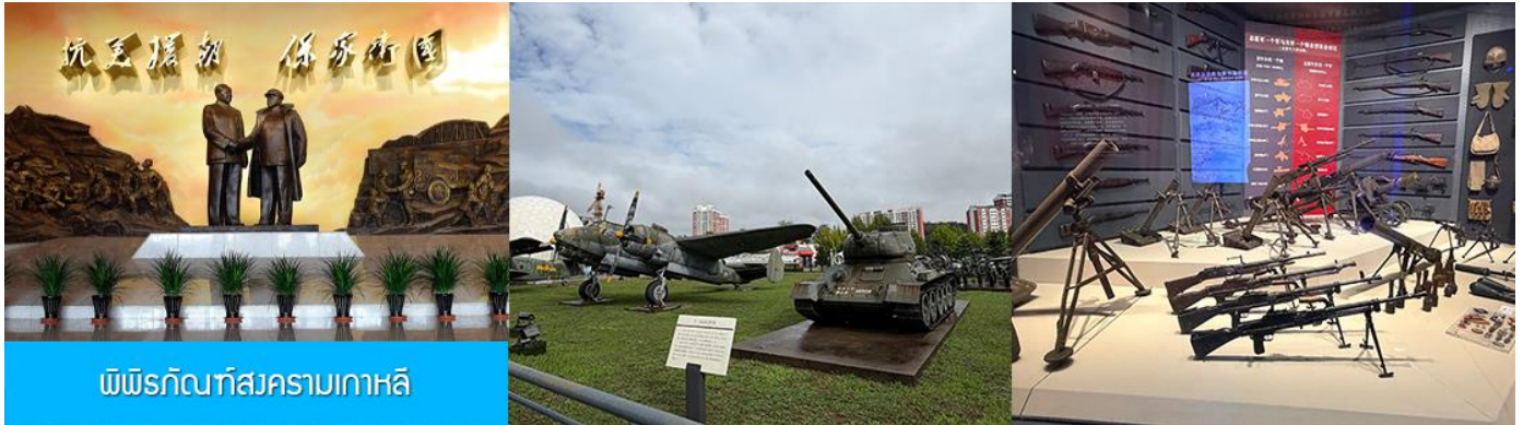
พิพิธภัณฑ์สงครามเกาหลี