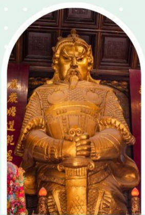
วัดเซกวง

"ไหว้พระ เสริมดวง เพิ่มสิริมงคลแก่ชีวิต"