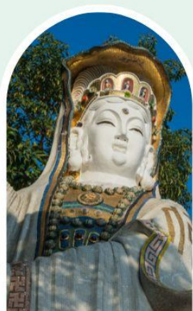
เจ้าแม่กวนอิม ธิพลสภย์