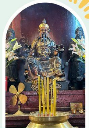
วัดปุกโตฮองฮำ