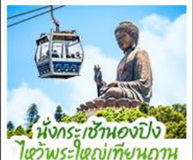
เนิงกระเซ้าของปิ้งสีการะพระใหญ่เทียนถาน