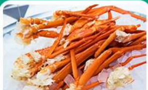
พิเศษ! บุฟเฟ่ต์ขาปู