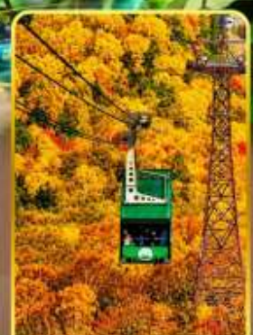
กระเช้าโรดาคะ