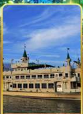
ล่องเรือทะเลสาบโทยะ