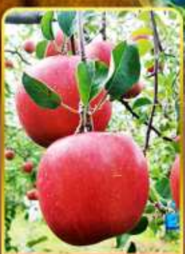
เก็บแอปเปิล