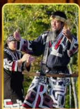
พิพิธภัณฑ์โอนู