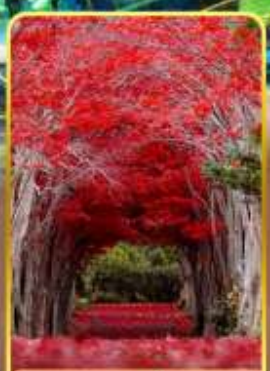
สวนฮิราโอกะ