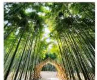
ป่าไฟวากายามะ