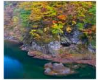
ซุนเขาดากิไคริ