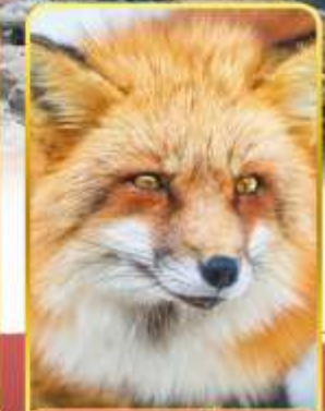
ฟาร์มสุนัขจิ้งจอก