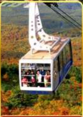
นั่งกระเช้าอีกโกดะ