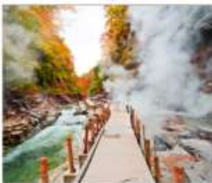
ซุนเขาโอยาสึเดียว