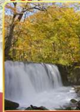
ลำธารโออิราสะ