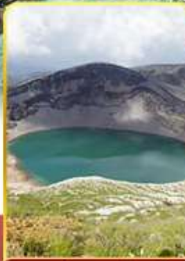
ปากปล่องภูเขาไฟซาโอ