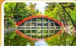
ศาลเจ้าสุมิโยชิ โกเบ