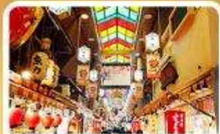
ตลาดปลาชิชิ