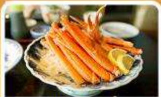
พิเศษ! ซาซิมิ