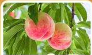
กิจกรรมเก็บผลไม้