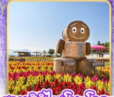
สวนซึกิไซโนะโอะกะ