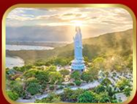
ฮอพรควนอิม วัดหลินอึ้ง