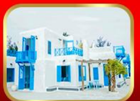
คาเฟ่ Son Tra Marina