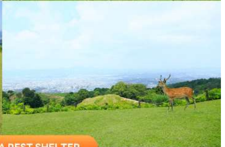
MT. WAKAKUSA REST SHELTER