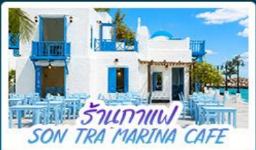
ร้านกาแฟ SON-TRA MARINA CAFE