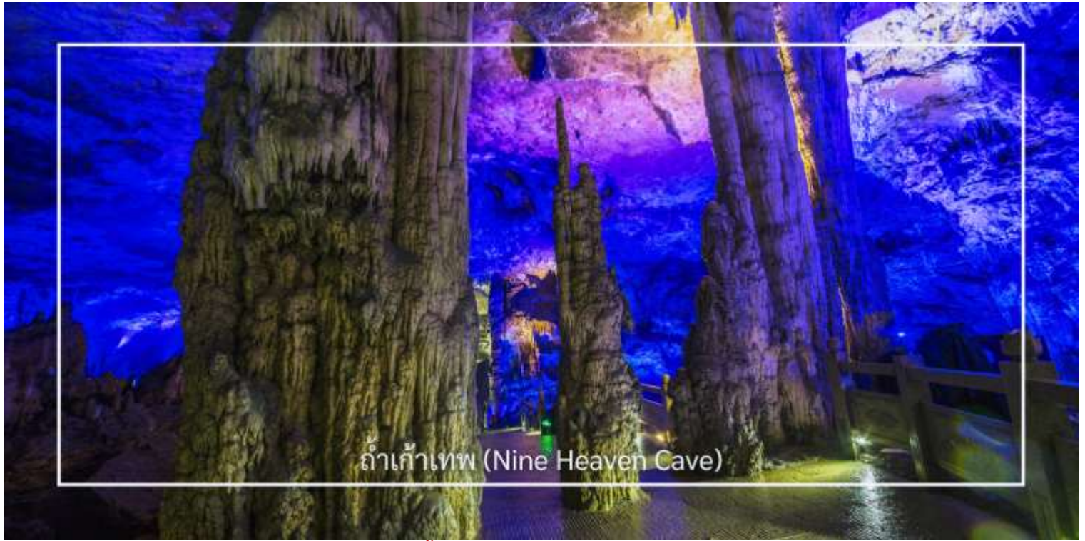
ถ้ำเก้าเทพ (Nine Heaven Cave)