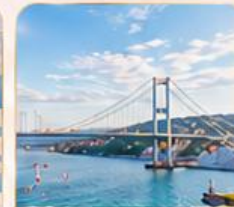
BOSPHORUS STRAIT ช่องแคบบอสฟอรัส