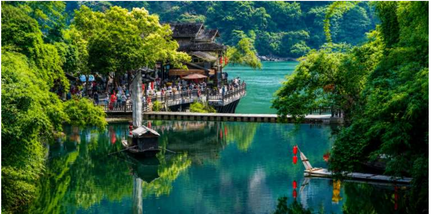
เที่ยง บริการอาหารเที่ยง ณ ภัตตาคาร (มื้อที่2)

นำท่านสู่ หมู่บ้านซานเซียเหรินเจีย (Sanxia Renjia) (รวมล่องเรือ) สถานที่นี้เป็นที่รู้จักกันในชื่อ หมู่บ้านสามผา แหล่งท่องเที่ยวระดับ 5A ตั้งอยู่ในเขตหุบเขาสามผา ริมแม่น้ำแยงซีเกียง โดดเด่นด้วยทัศนียภาพทางธรรมชาติอันงดงามของ ภูเขาหินผา สายน้ำ และหุบเขาที่โอบล้อมกันอย่างกลมกลืน สถานที่แห่งนี้สะท้อนวิถีชีวิตดั้งเดิมของชาวลุ่มแม่น้ำแยงซี เกียง ผ่านสถาปัตยกรรมพื้นบ้าน วัฒนธรรม ประเพณี ที่ยังคงเอกลักษณ์ไว้อย่างครบถ้วน พร้อมให้ท่านได้ชมการแสดง เรื่องราวเกี่ยวกับวิถีชีวิตควบคู่กับสายน้ำ