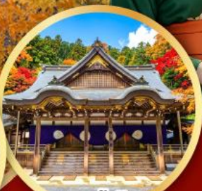
ศาลเจ้าฮิสะ