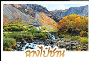
ฉางไป่ชาน