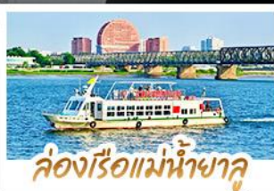
ล่องเรือแม่น้ำฮาลู