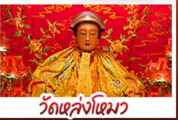
วัดเล่งจื๊อ