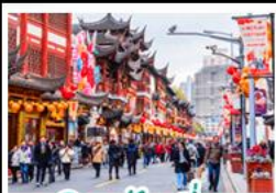
เมืองเซี่ยงไฮ้