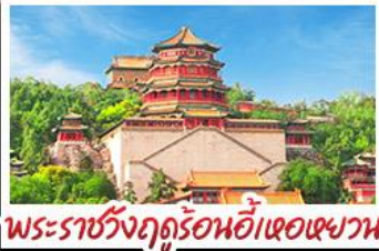
พระราชวังฤดูร้อนอี่เหอหยวน