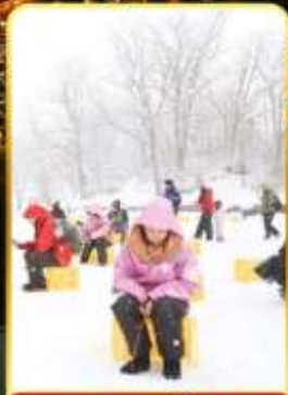
ตกปลานบนน้ำแข็ง