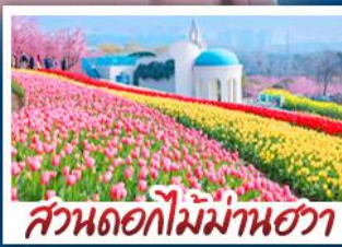
สวนดอกไม้บ้านฮวา