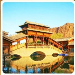
เมืองเล็กตันเสี่ยโซ่ว