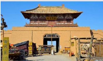
เมืองโบราณตุนหวง