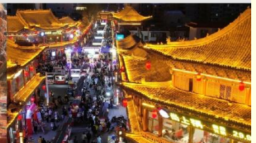
ตลาดกลางคืนจางเย่

*ทางบริษัทฯ ขอสงวนสิทธิ์ในการสลับโปรแกรมทัวร์ตามความเหมาะสมขึ้นอยู่กับสถานการณ์หน้างาน โดยคำนึงถึงผลประโยชน์ของลูกค้าเป็นสำคัญ