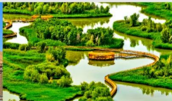
อุทยานพื้นที่ชุ่มน้ำจางเย่