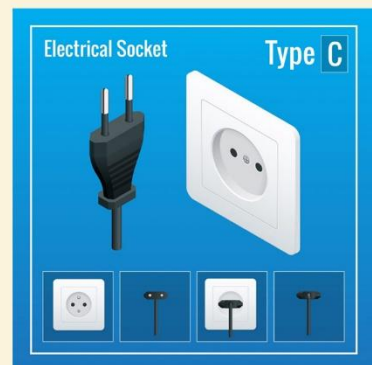
ปลั๊กไฟที่ใช้ที่อียิปต์