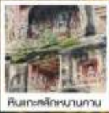
ศิลปะสถาปัตยกรรม