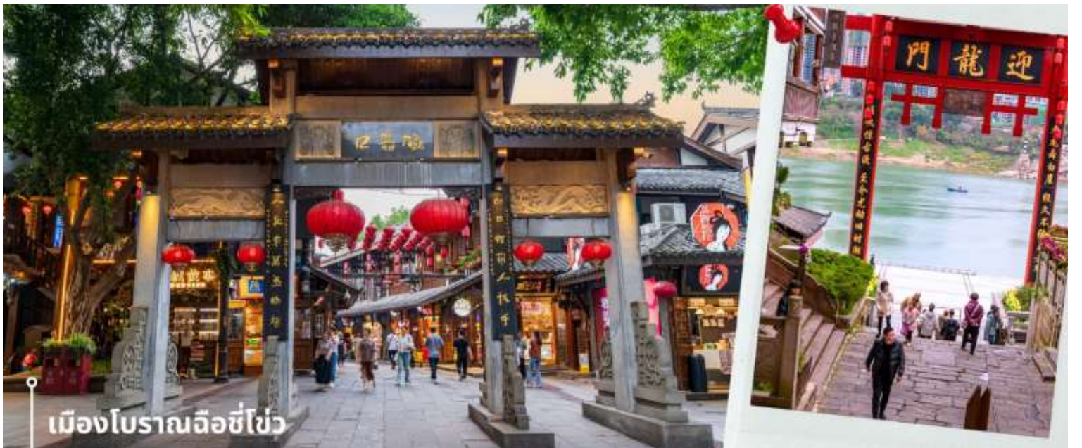
เมืองโบราณฉือชี่ไช่

หลังจากนั้นนำทุกท่านเดินทางสู่ เมืองโบราณฉือชี่ไช่ เมืองโบราณและสถานที่ท่องเที่ยวชื่อดังในมหานครฉงชิ่ง ประเทศจีน ที่อนุรักษ์สถาปัตยกรรมและวิถีชีวิตดั้งเดิมไว้และได้เป็นสถานที่ท่องเที่ยวระดับ 4A ของจีน ประวัติศาสตร์ยาวนาน มีลักษณะคล้ายตลาดเก่าโบราณริมแม่น้ำเจียหลิง เป็นแหล่งรวมของขนม ของกินพื้นเมือง ของฝาก รวมถึงมีวัดและร้านค้ามากมาย ให้ความรู้สึกเหมือนได้ย้อนเวลากลับไปในอดีต ภายในพื้นที่เต็มไปด้วยร้านค้าเก่าแก่ที่ขายทั้งอาหารพื้นเมือง ของกิน และของฝากมากมาย ทั้งยังมีการแสดงวัฒนธรรมพื้นบ้านให้นักท่องเที่ยวได้ชม ให้ความรู้สึกเหมือนหลุดเข้าไปในซีรีส์จีนย้อนยุค ที่เที่ยวฉงชิ่ง ที่เหมาะแก่การมาเดินเที่ยว ชิมอาหาร ถ่ายรูป และสัมผัสวิถีชีวิตแบบดั้งเดิมของชาวฉงชิ่งอย่างใกล้ชิดในบรรยากาศที่แสนสบาย