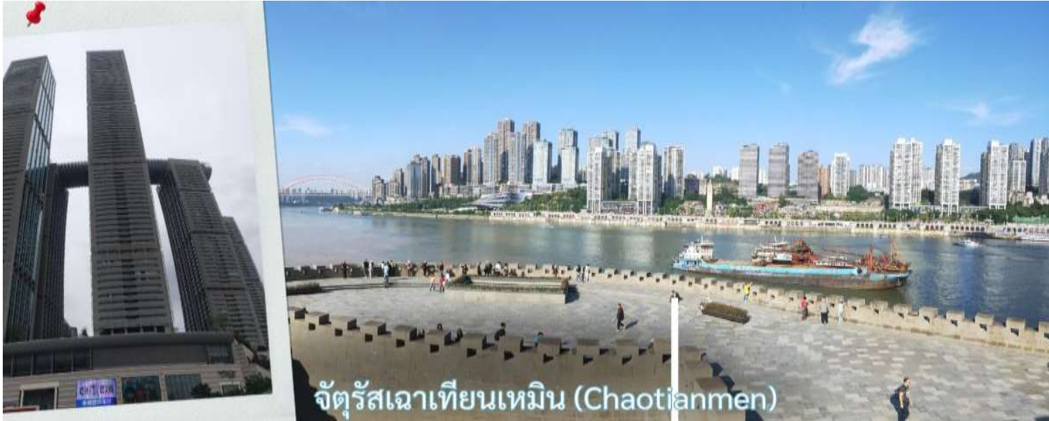
จัตุรัสเฉาเทียนเหมิน (Chaotianmen)

จากนั้น นำท่านเดินทางสู่ จัตุรัสเฉาเทียนเหมิน ซึ่งตั้งอยู่ ณ จุดบรรจบของ แม่น้ำแยงซี และ แม่น้ำเจียหลิง นับเป็นท่าเรือขนส่งทางน้ำที่ใหญ่ที่สุดของนครฉงชิ่ง และเป็นศูนย์กลางการค้าสำคัญมาอย่างยาวนาน บริเวณนี้ยังเป็นที่ตั้งของ ตลาดการค้าครบวงจรเฉาเทียนเหมิน ซึ่งถือเป็นตลาดขนาดใหญ่ที่สุดของฉงชิ่ง ทำให้พื้นที่โดยรอบเต็มไปด้วยผู้คนและมีชีวิตชีวาอยู่เสมอ ตั้งแต่อดีตจนถึงปัจจุบัน จัตุรัสแห่งนี้ได้รับการออกแบบให้มีลักษณะคล้ายเรือยักษ์ที่กำลังแล่นออกสู่สายน้ำอย่างสง่างาม จึงได้รับสมญานามว่า “ไททานิคแห่งฉงชิ่ง” เมื่อยืนอยู่บนจัตุรัส ท่านจะสามารถมองเห็นภาพอันน่าประทับใจของจุดบรรจบระหว่างแม่น้ำสองสาย โดยน้ำสีเหลืองของแม่น้ำแยงซีและน้ำสีเขียวมรกตของแม่น้ำเจียหลิงไหลมาบรรจบกันอย่างชัดเจน สร้างทัศนียภาพที่สวยงามและเป็นเอกลักษณ์ของฉงชิ่งอย่างแท้จริง