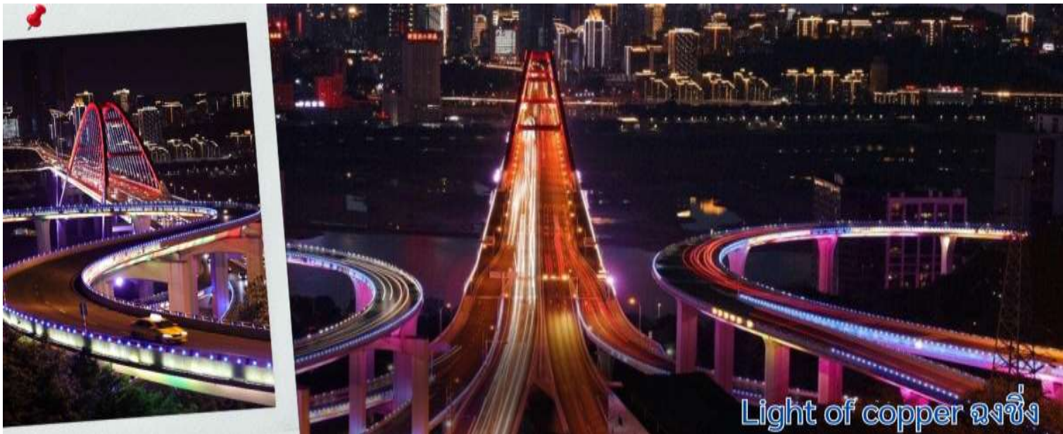
Light of copper ฉงชิ่ง

แวะถ่ายรูปวิวที่ Light of copper ฉงชิ่ง เป็นจุดชมวิวชื่อดังในมหานคร ฉงชิ่ง ประเทศจีน ซึ่งได้รับความนิยมอย่างมากในกลุ่มนักท่องเที่ยวและช่างภาพ จุดชมวิวทางยกระดับโดดเด่นด้วยทางเดินลอยฟ้าทรงกลมที่เชื่อมต่อกันสามารถมองเห็นวิวพาโนรามาของ สะพานซูเจียป่า (Sujiaba Interchange) ที่โค้งไปมาอย่างซับซ้อน และสะพานข้ามแม่น้ำแยงซีเกียง ไช่หยวนป่า (Caiyuanba Bridge) ท่ามกลางตึกสูงระฟ้าบรรยากาศยามค่ำคืน เมื่อเปิดไฟเมืองในช่วงค่ำจะเห็นแสงสีทองและสีทองแดงสะท้อนความงดงามของ "เมืองภูเขา" ได้อย่างชัดเจน