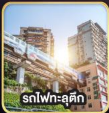
รถไฟฟ้าชุกติ๊ก