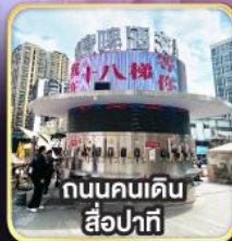
ถนนคนเดิน สี่ป่าทิ