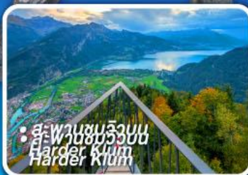
• สะพานชมวิวยอด Harder Kllum