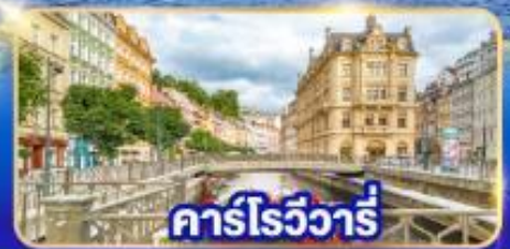
คาร์โรวารี